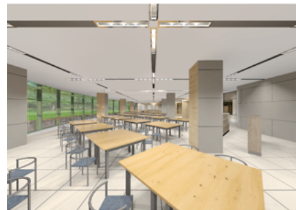
リニューアルイメージ

学生食堂がゼロカーボン・SDGsの理念の下に生まれ変わります。 県大の新たな交流拠点となり得る、学生や教職員にとって居心地が良く、地域の方も気軽に訪れるような場所を目指します。 学生会館1階の全体イメージはQRコードからご覧いただけます。